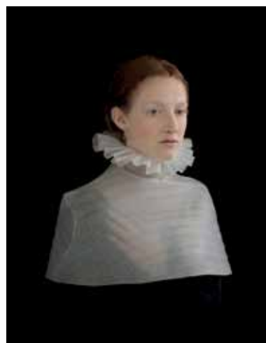
Suzanne Jongmans: 'Meisje in mantel', 60 x 75 cm.

Bagagehal Loods 6 KNSM Laan 289 Amsterdam Toegang gratis 23-09 t/m 02-10