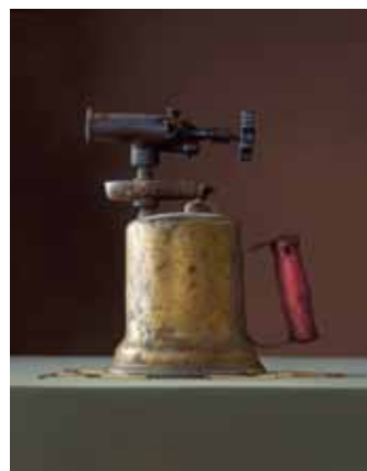
'One more Shot'. Olieverf op paneel, 33 x 58 cm.

Geboren in Nederland vertrok Braldt Bralds op 27-jarige leeftijd naar Amerika, alwaar hij in New York onder meer les gaf. Bralds schildert al zijn hele leven en, zonder het te weten, kent iedereen zijn werk van tientallen geschilderde portretten van staatshoofden, uitvinders en publieke figuren, die hij maakte voor de covers van magazines als 'der Spiegel', 'Rollingstone' en 'National Geographic'. Ook schilderde hij vele werken in